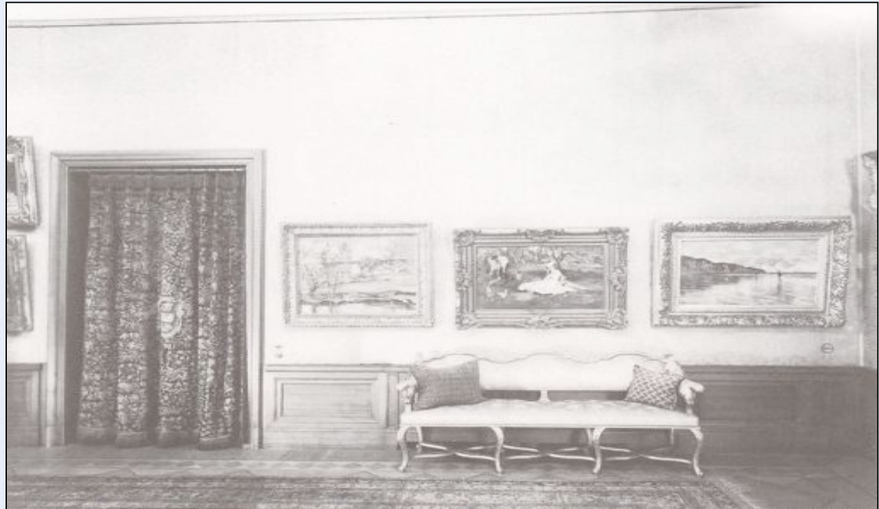
Paul Cézanne, Edouard Manet, Claude Monet